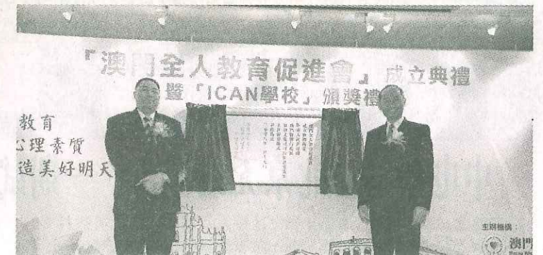
教育 心理素質 造美好明天

全人教育基金是香港一个非牟利志愿机构,创办成员包括赞助人全国人大常委及香港立法会主席范徐丽泰太平绅士、主席黄重光医生、