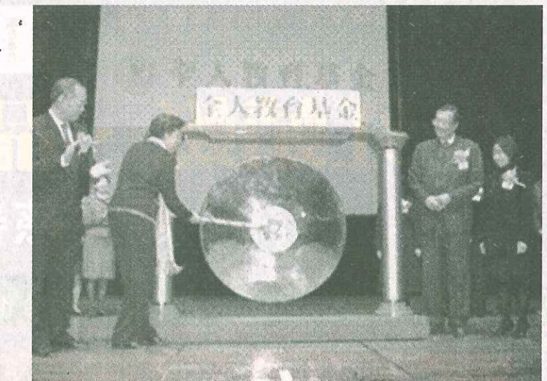
全人教育基金成立典礼

和工商界等专业所得经验而创立，以科学为本、以价值为基础的实践心理学模式。“ICAN”实践心理学的目的是要协助大家发挥更大的心理力量，促使生活得以成功、进步和快乐：