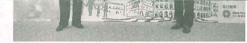
澳门全人教育促进会成立典礼主礼嘉宾：澳门社会文化司崔世安司长（左）

黄重光医生创立了科学为本的“ICAN”实践心理学模式，并在香港、澳门及国内积极推动提升成年人和儿童心理素质的培训工作，为构建和谐社会国家作出努力。他因此获得中国公益事业发展大会颁授“中国文化教育业2007十大社会公益人物”荣誉。黄医生推动中国精神与心理医学领域发展，得到“中国国际权威专家协会”邀请，成为“中国医学领域权威专家”及“中国国际权威专家协会医学专业委员会副主席”，并将其“ICAN”实践心理学模式定为“中国医学研究领域定点研究示范单位”。在2008年，他分别得到中国心理健康促进会的邀请成为“常务理事”，并被授予“中国百名心理学杰出成就奖”的荣誉；受中国国际专业科学家学会的邀请成为“医疗专业科学家理事会副理事长”并被授予“中国百名专业贡献杰出人士‘金牛奖’”的荣誉；及被全国心理卫生协会的邀请成为“特邀顾问”，并被授予“全国十大心理学功勋人物之星”荣誉。